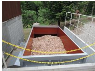
昇温用の小型の灯油ボイラ2台は撤去して、熱交換器に置き換えました。サイロはコンテナ式を採用しました。