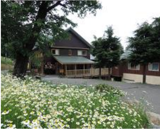
社員の保養所として作られた建物が地域の木材を用いた環境の宿としてリノベされました。

国産カモミールを原料としたスキンケアブランド「華密恋」を製造するカミツレ研究所が運営するビオホテル「八寿恵荘」にチップボイラWTH100を導入しました。ボイラの熱は大浴場の加温と宿の床暖房に使われています。