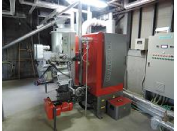
新たに100kWのチップボイラを導入し、既存の灯油ボイラ（290kW）はバックアップボイラとして使っています。