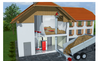
建物の2階 垂直オーガーで充填します。 燃料はダウンパイプ付のアジテーターシステムで排出されます。