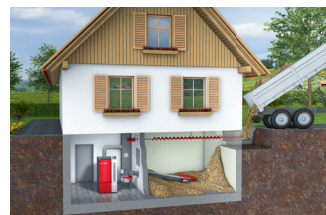
地下室 水平オーガーで充填できます。