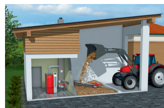
隣接建物/地上レベル チップャやフロントローダー付のトラクタによって 充填できます。