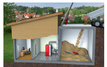
地域暖房ネットワークのシステム 地下燃料貯蔵室には上から簡単に投入できます。