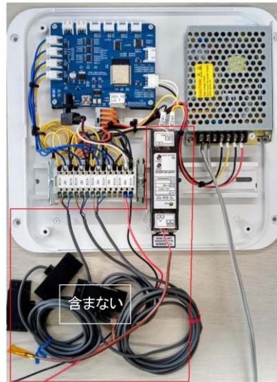
基本ユニットの内部