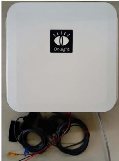
基本ユニットの外観