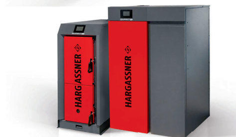
薪ボイラ（左） ペレットボイラ（右）