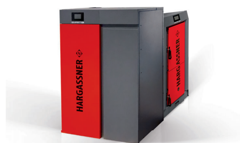
ペレットボイラ（左） 薪ボイラ（右）