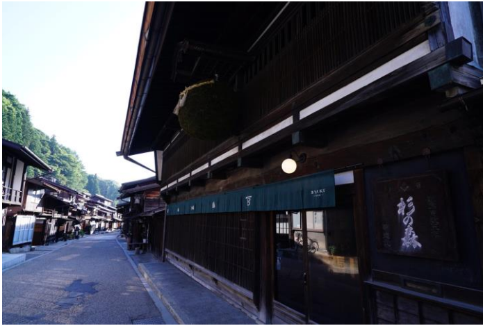
中山道の宿場町である奈良井宿は日本の中世の面影を色濃く残しています。

寛政五年創業の杉の森酒造をリノベして誕生した宿「BYAKU - Narai」にチップボイラ Eco-HK120を導入しました。ボイラの熱は大浴場の加温とレストランの床暖房に使用されています。