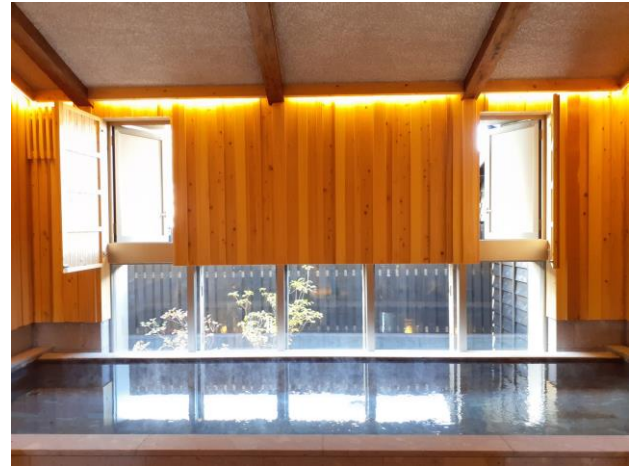
温浴施設「山泉」はボイラの主な利用先です。今回、リノベにあわせて酒造も再開されました。