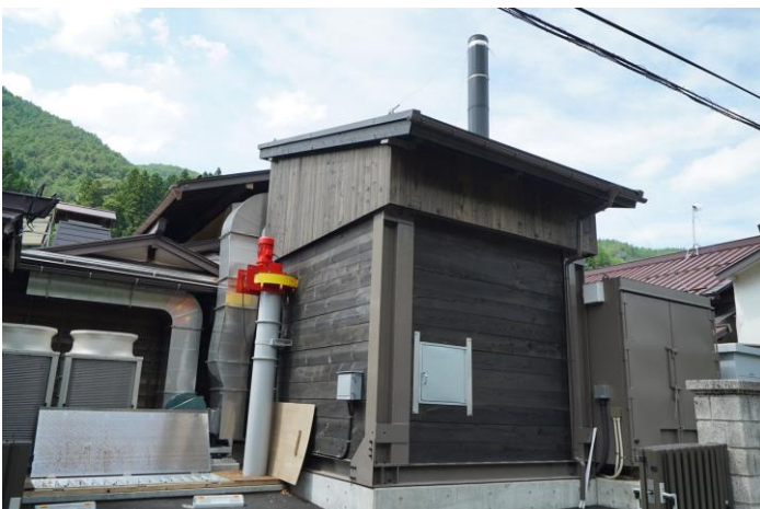
左からチップの垂直搬送機、木製チップサイロ、ボイラコンテナ