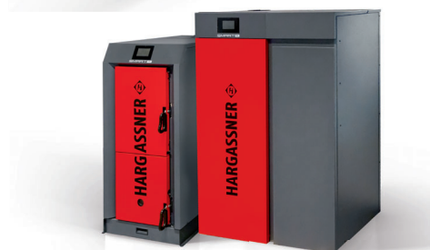
薪ボイラ（左） ペレットボイラ（右）