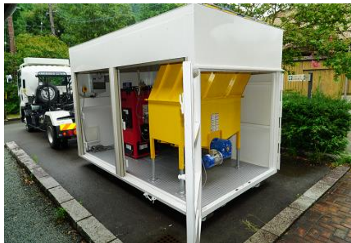
30kWボイラの例 (燃料サイロを収納)