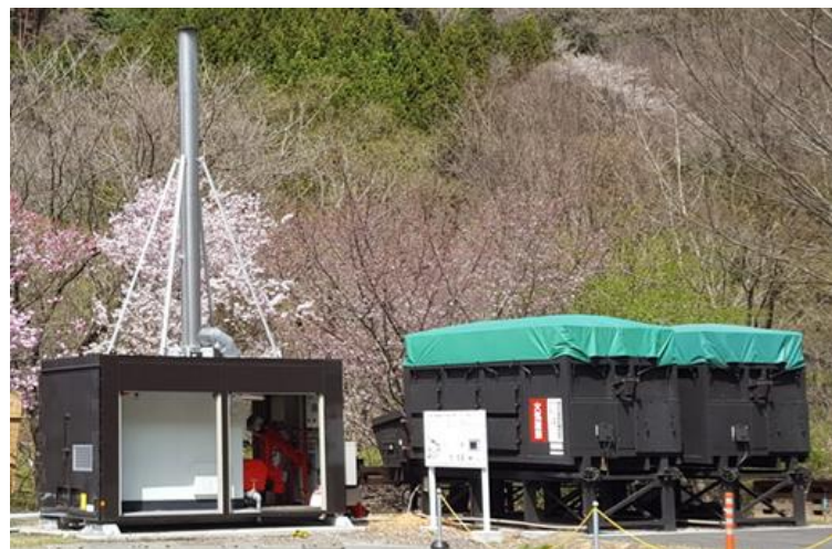
150kWボイラの例 (2台の燃料コンテナと接続)